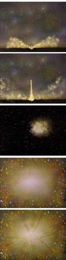
Filmstills aus dem gemalten Film: „Die Fährte“ Elke Nebel