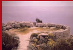
Andreas Schön „Varigotti“

Die Kunstschule soll Begeisterung für die Kunst entfachen und erweitern. Kunst und Kultur sollen umfassend begriffen werden. Dazu gehören das eigene Arbeiten, die theoretische Reflexion, Exkursionen zu Ausstellungen, das Konzipieren von Ausstellungen sowie der Dialog mit Künstlern/innen. Das Spektrum der Aktivitäten der geplanten Ateliers soll breit und offen angelegt sein. Die Teilnehmer dieser Ateliers sollen zu freier und begleiteter Atelierarbeit angeregt werden, so wie es einer akademischen Ausbildung entspricht. Sie sollen selbststän-