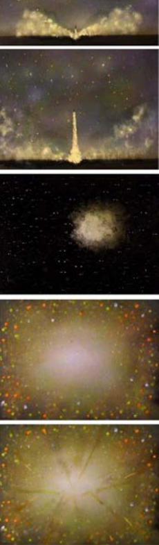
Filmstills aus dem gemalten Film: „Die Fährte“ Elke Nebel